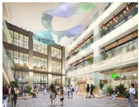
商業施設アトリウムイメージ