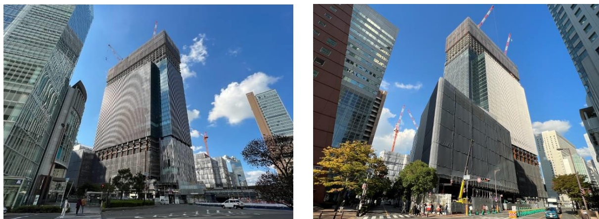
建設工事の様子（左：JR大阪駅前南側から、右：本計画地南西側から）2022年11月2日時点

地上の鉄骨工事が完了し、本日上棟しました。2024年の建物竣工を目指し、工事は順調に進んでいます。