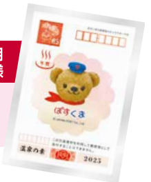
※デザインはイメージです。