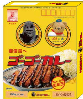
※デザインはイメージです。