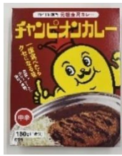
「チャンピオンカレー（中辛）」 株式会社チャンピオンカレー+TK