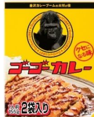
「ゴーゴーカーレーレトルト（2食入り）」 日本製菓株式会社 ボルカノ食品事業部