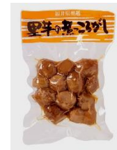
「福井県奥越 里芋の煮ころがし」 有限会社米又