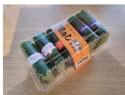
「連子鯛入り三味笹寿し」