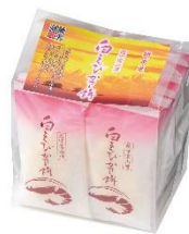
「越中富山湾 白えびかき餅 14袋」 株式会社御菓蔵