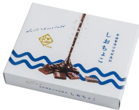
「しおちょこ」 株式会社 Ante